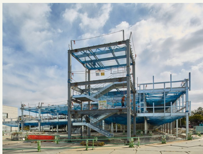
2025年2月18日 立体駐車場の鉄骨建方工事を進めています。

病院本体棟は、昨年末より開始した1階梁鉄骨の建方が完了し、床コンクリートの打設を進めています。6月の上棟を目指し、これから地上躯体工事が本格化します。4月中旬より、内装工事、外装工事を開始する予定です。病院本体棟に隣接する保育棟は1階床コンクリートの打設が完了、その隣の講堂棟は、基礎躯体工事が完了し、1階床の躯体工事を進めています。立体駐車場では、鉄骨建方工事を進めています。