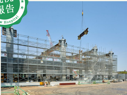
2025年4月17日 病院本体棟の3階床躯体工事として梁鉄骨を取り付けています。